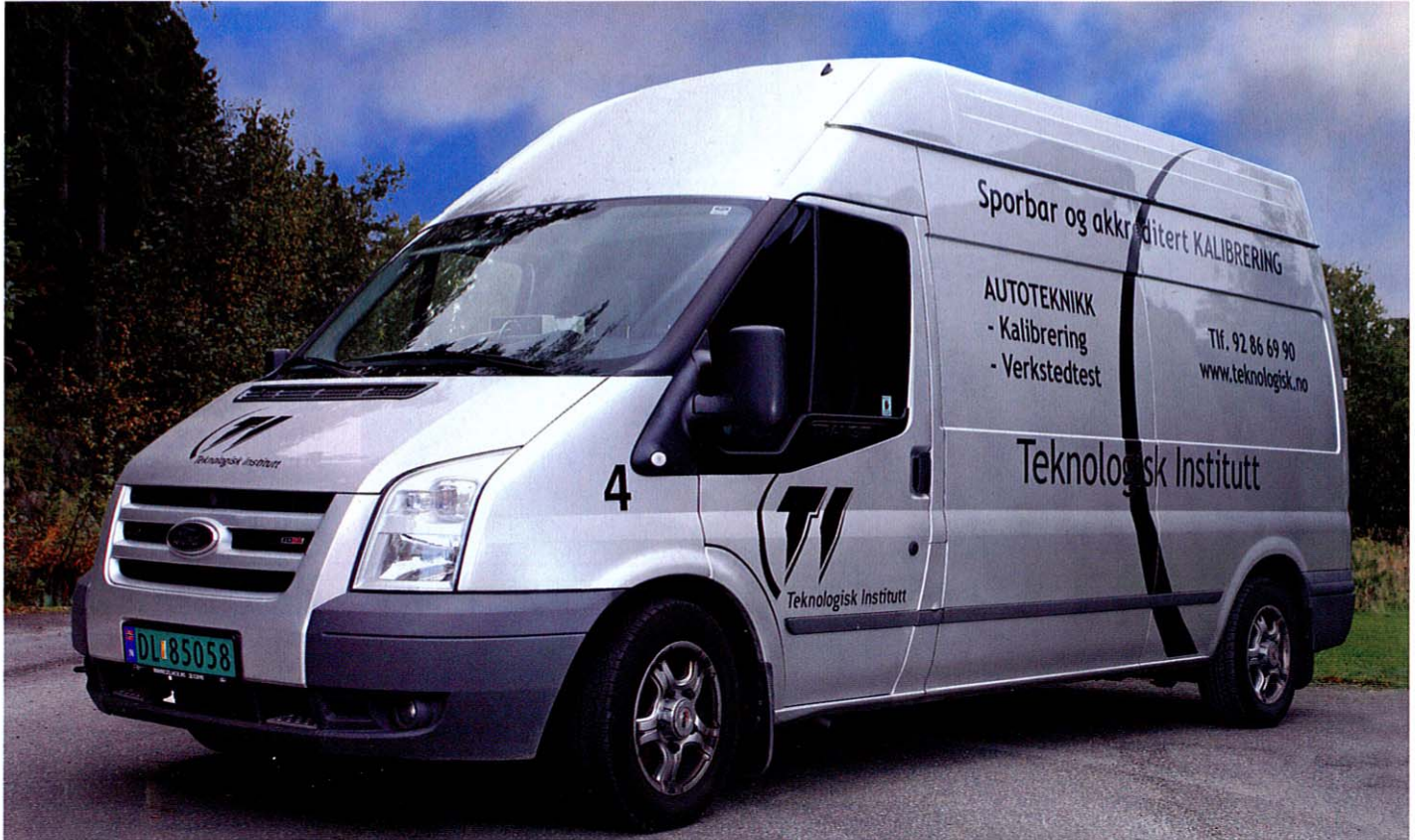
Fire slike biler har TI rullende rundt i hele landet.